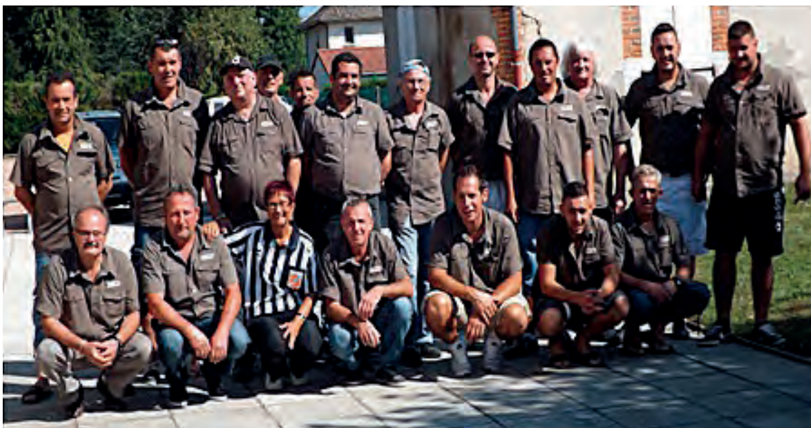
Les deux équipes qui ont représentées le club avec honneur lors des différents Championnats accompagnées de leur arbitre.

En 2016 le CDA fêtera ses 50 Ans, de nombreuses manifestations seront organisées avec le concours des clubs de l'Allier.