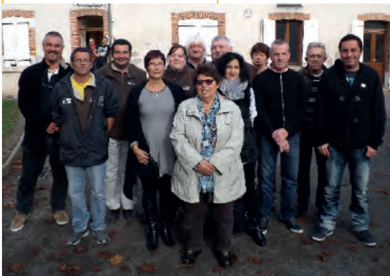
L'Assemblée Générale 2014

Samedi 11 avril : Préliminaire Triplette Samedi 9 mai : Challenge JP.ROUBEIX en Triplette Dimanche 28 juin : Semi-Marathon en Triplette Mixte Samedi 18 juillet : Triplette Dimanche 19 juillet : Doublette Dimanche 30 août : Doublette