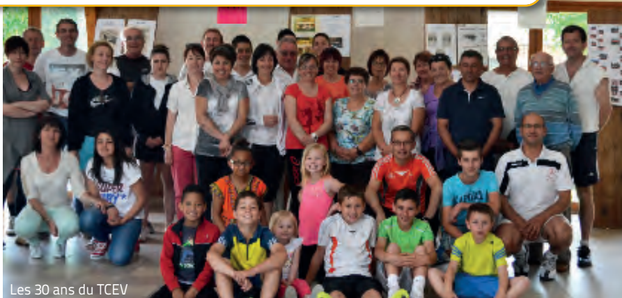
Les 30 ans du TCEV