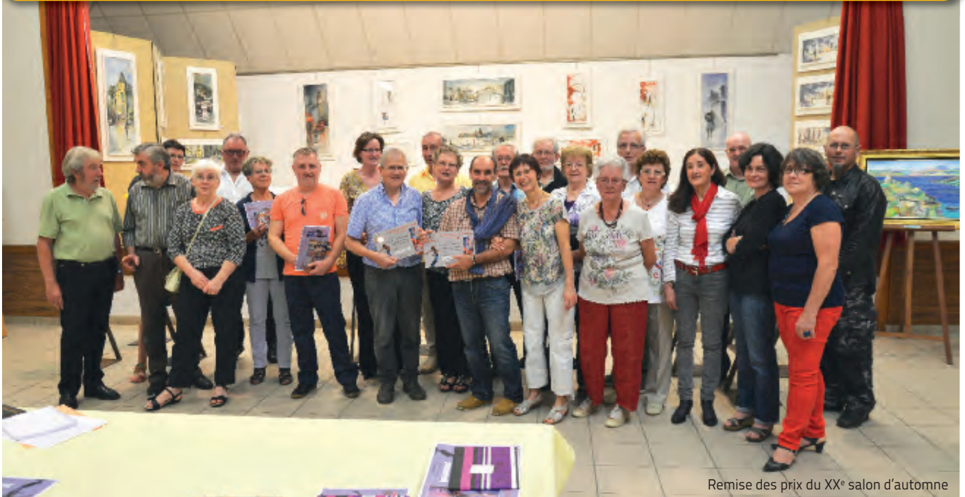
Remise des prix du XX e salon d'automne

XXI e Salon d'Automne qui aura lieu du 10 au 18 octobre 2015.