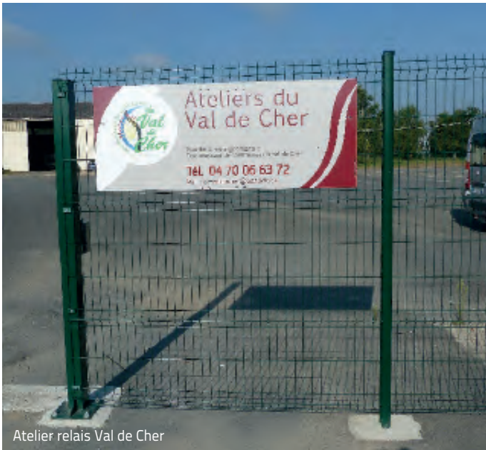
Atelier relais Val de Cher