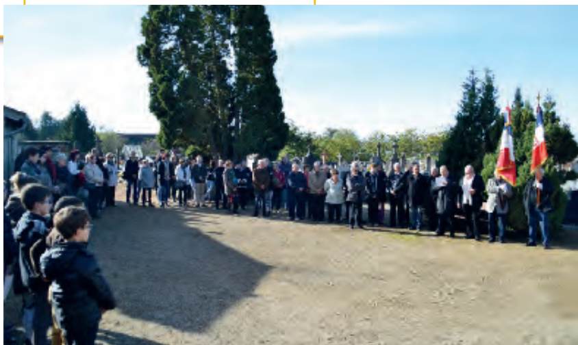
Commémoration du 11 novembre 2014

La section ACPG-CATM VEUVES vous présente leurs meilleurs vœux pour 2015.