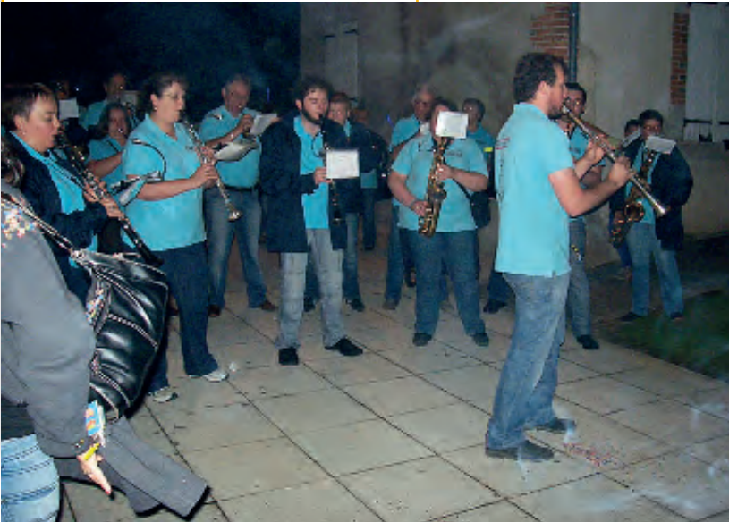
Retraite aux flambeaux du 12 juillet 2014

Pour l'année 2014 le Comité des Fêtes malgré une baisse importante de ses bénévoles à poursuivi ses efforts pour animer la commune et l'ensemble des manifestations a connu un véritable succès. L'équipe du Comité des Fêtes prouvera son dynamisme en 2015 en vous proposons un programme très varié.