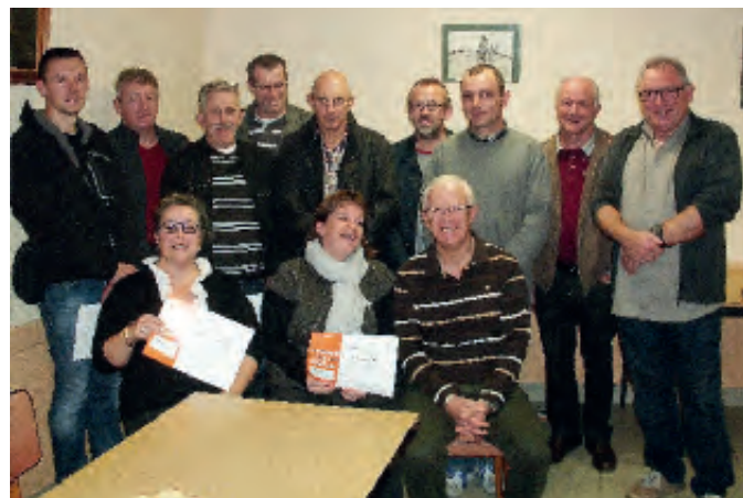
Remise de médailles en 2014