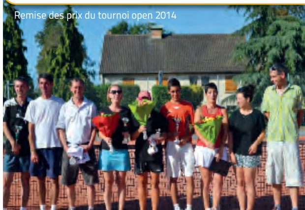
Remise des prix du tournoi open 2014

17 janvier : Galette des rois 1 er mars : Loto avec le CSVE Fin aout- début septembre : : 13 e Tournoi open