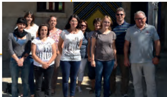
Enfants Pôle Enfance Jeunesse

L'école accueille 98 élèves dans les locaux tous neufs depuis la rentrée de Toussaint 2014.