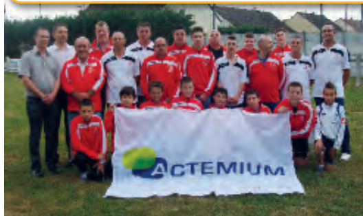
Remise de tenue par les sponsors

1 mars 2015 : Loto avec le club de tennis 31 décembre 2015 : Réveillon