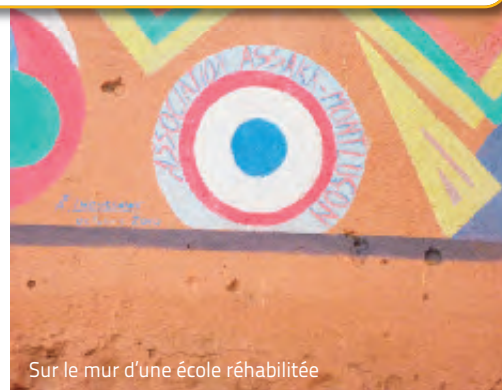
Sur le mur d'une école réhabilitée

Tous les fonds récoltés sont entièrement reconvertis sur place sans intermédiaire.