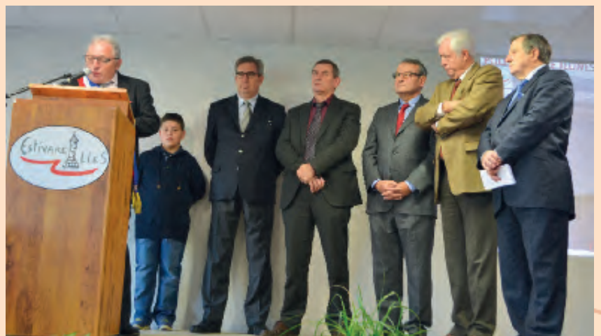
L'inauguration : M.PAILLERET (Maire) - M.COCHET (Préfet) - M.DUFREGNE (Président Conseil général) - M.DÉRIOT (Sénateur) - M.DUGLERY (Président du Pays de Montluçon) - M.LESTERLIN (Député)