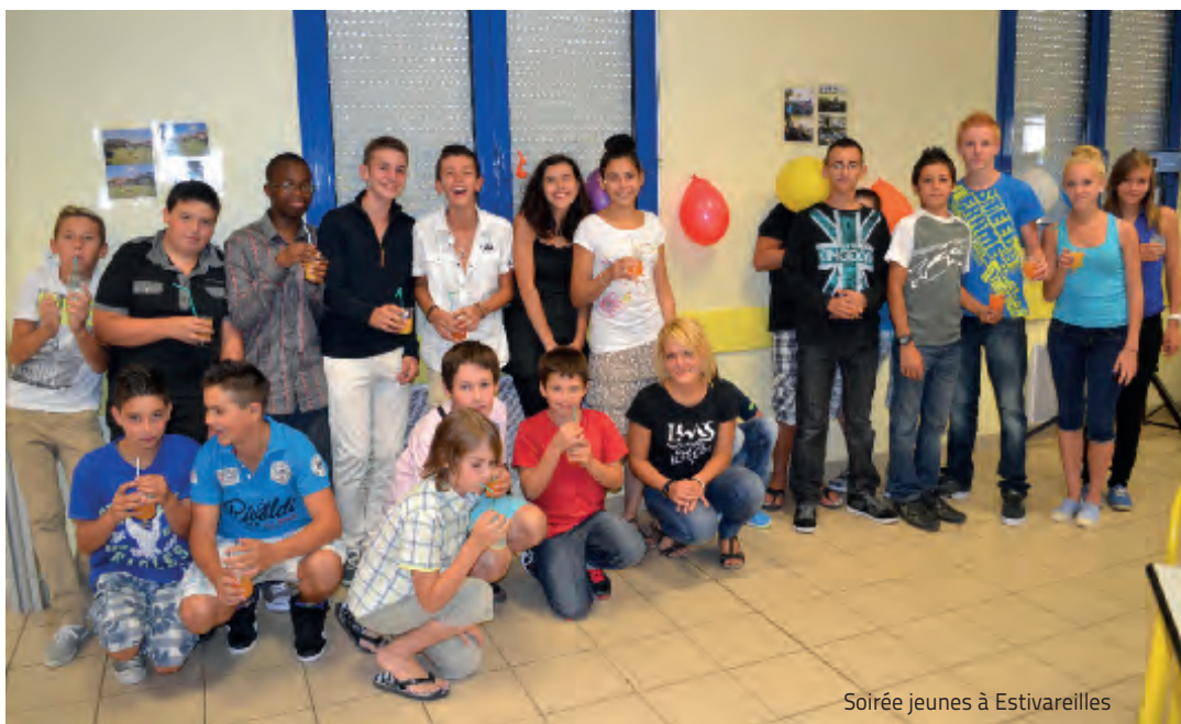
Soirée jeunes à Estivareilles

Cette année des évolutions majeures ont eu lieu dans notre Communauté de Communes, afin de tenir