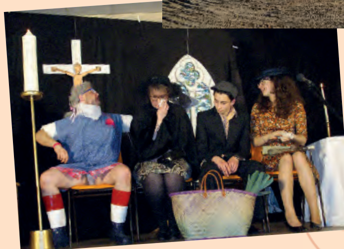
Soirée théâtre du Comité des Fêtes