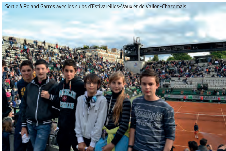
Sortie à Roland Garros avec les clubs d'Estivareilles-Vaux et de Vallon-Chazemais

Les animations proposées pendant les vacances scolaires d'hiver et de printemps ont connu un beau succès avec la participation de 25% des jeunes du territoire (près d'une centaine), ce qui est un bon résultat pour la deuxième année d'existence.