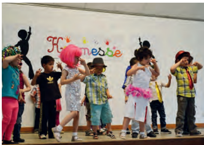
Rythme endiablé lors de la kermesse 2013