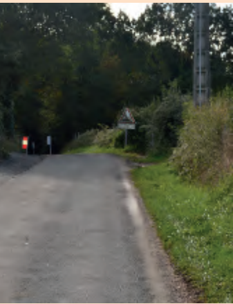
Elargissement route de la cote du chêne