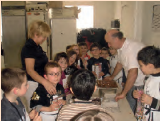
Apprentis pâtisseries pour Pâques