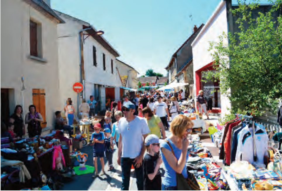
Brocante du 16 juin 2013