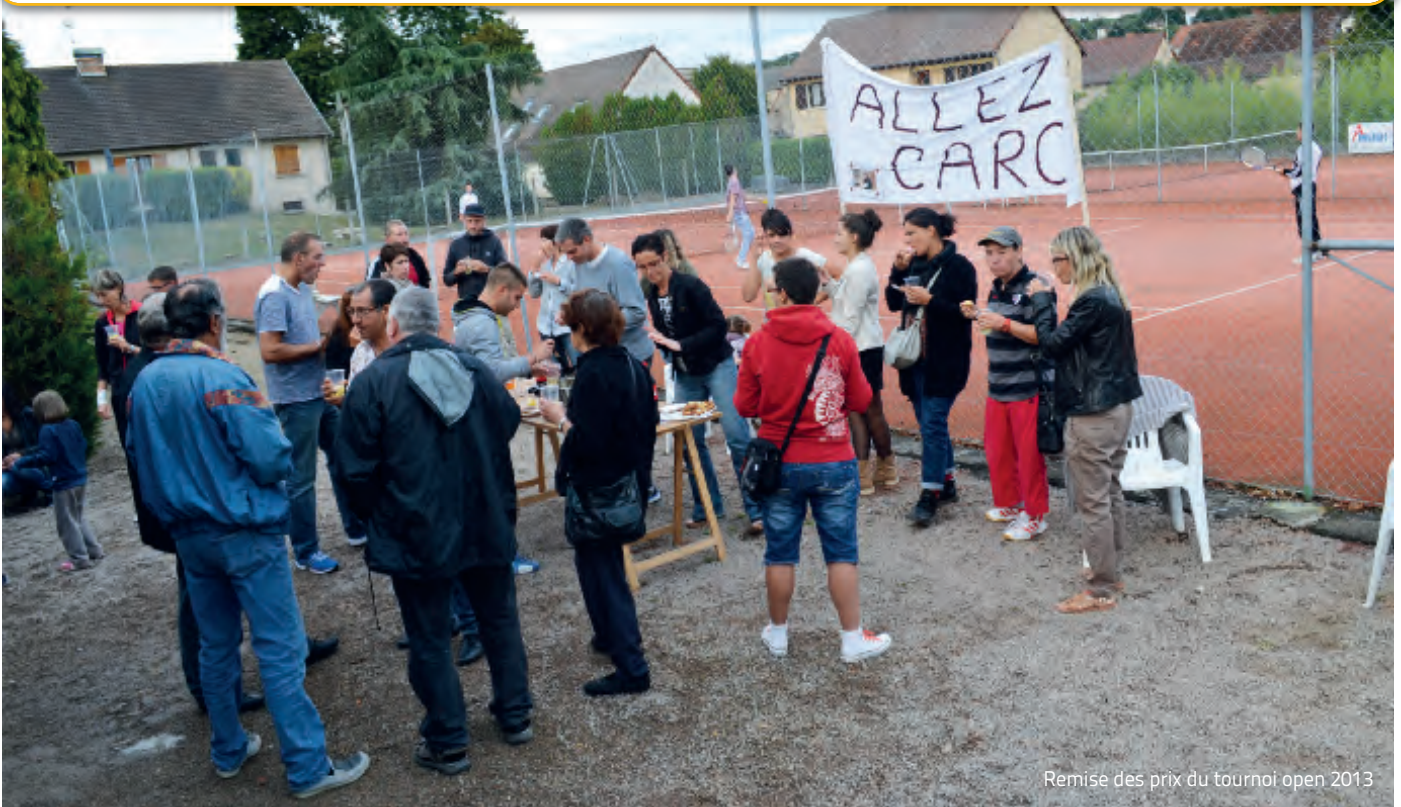
Remise des prix du tournoi open 2013

5-6 avril : 2 lotos avec le CSVE 1 juin : 30 ans du club 20 août - 7 septembre : Tournoi open