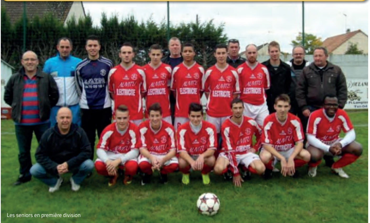
Les seniors en première division

5 et 6 avril : 2 lotos avec le club de tennis 31 décembre : Réveillon