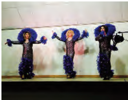
Soirée Cabaret du 16 mars 2013

A la demande générale ce thème sera renouvelé.