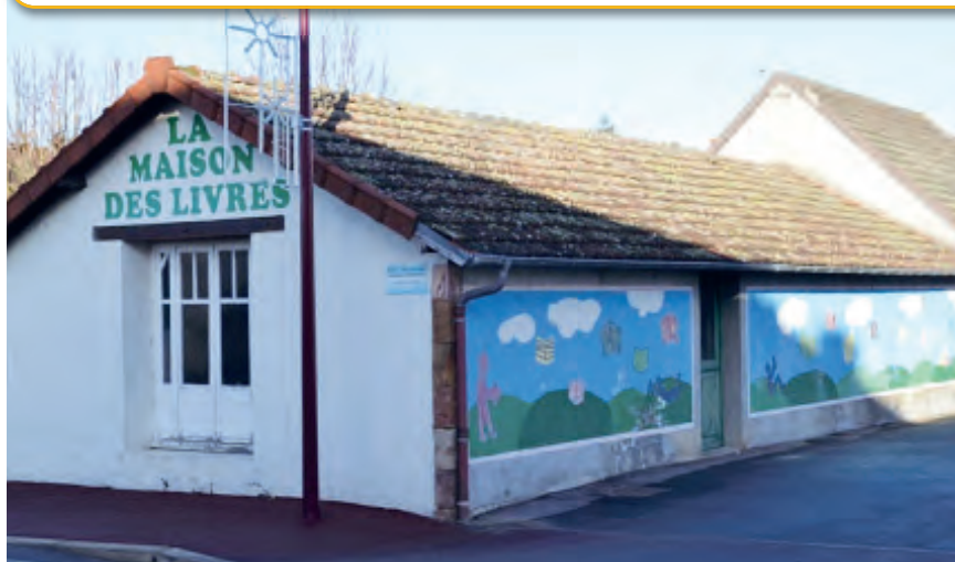
La maison des livres vous attend rue de la République

La bibliothèque est ouverte tous les mercredis de 14h30 à 17h. La bibliothèque de prêt de Comentry dépose régulièrement des dernières nouveautés pour tous types de lecteurs. Le prêt est gratuit.