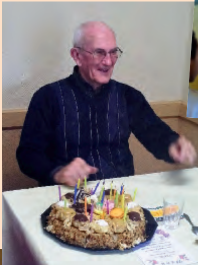
Les aînés soufflent les bougies