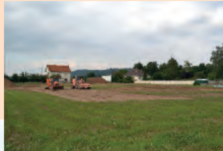
Pôle enfance jeunesse culture - août 2013