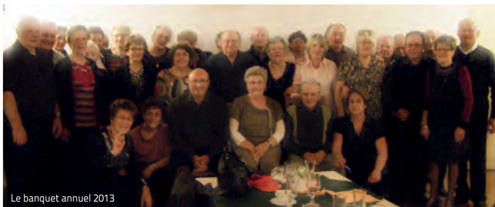
Le banquet annuel 2013

Une équipe qui a toujours « BON PIED - BON OEIL » !