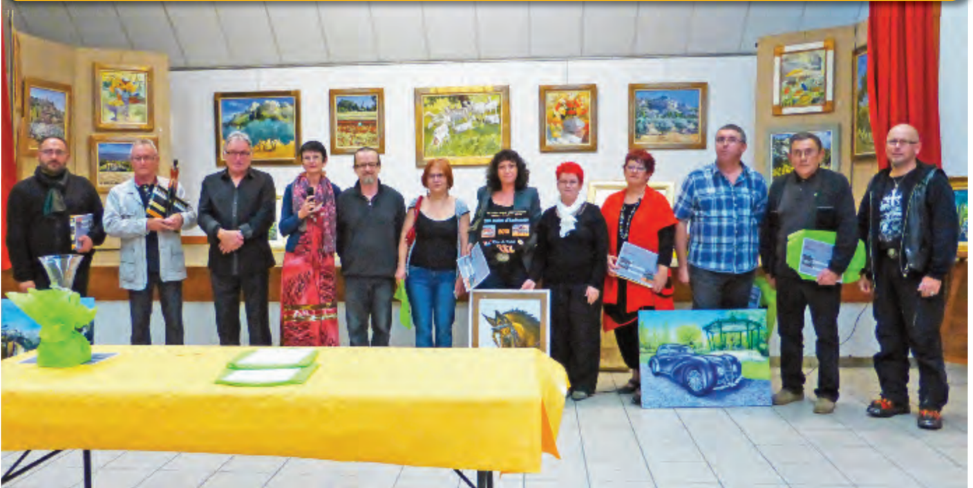
Remise des prix du 19 e salon d'Automne

XX e Salon d'Automne qui aura lieu du 11 au 19 octobre 2014