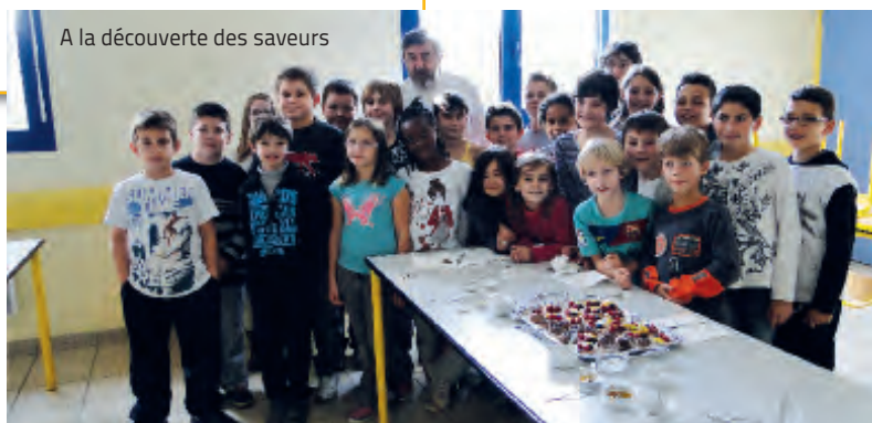
A la découverte des saveurs

Plusieurs événements vont ponctuer l'année scolaire.