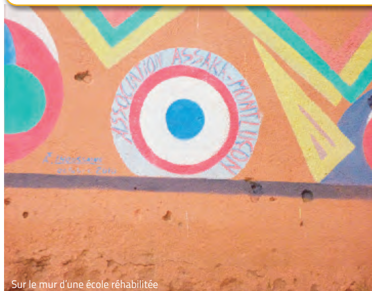
Sur le mur d'une école réhabilitée

Printemps : Journée karting Automne : Loto