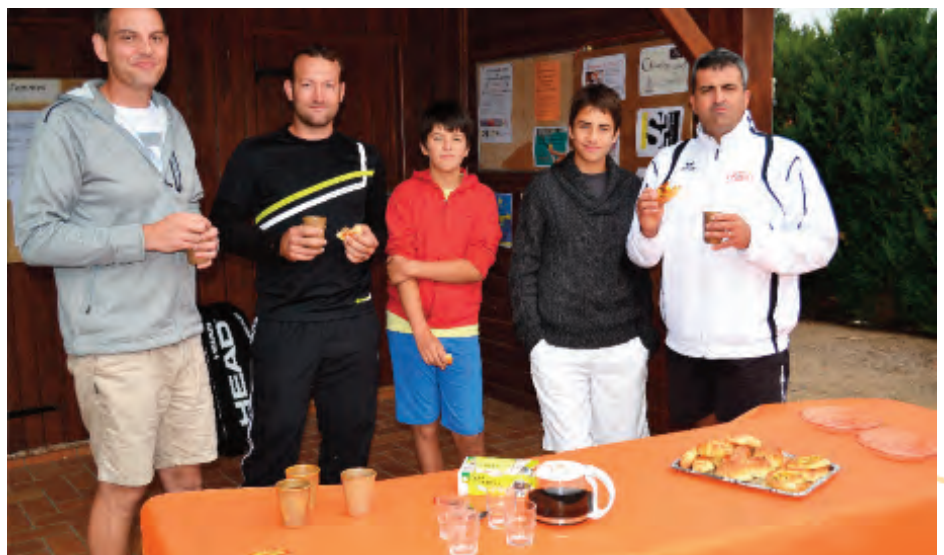
Une matinée café-croissant très appréciée lors du tournoi open 2013

Un merci à nos partenaires privés et à la mairie d'Estivareilles qui apporte son soutien régulier et un merci aux employés municipaux pour leur travail de mise en état des terrains.