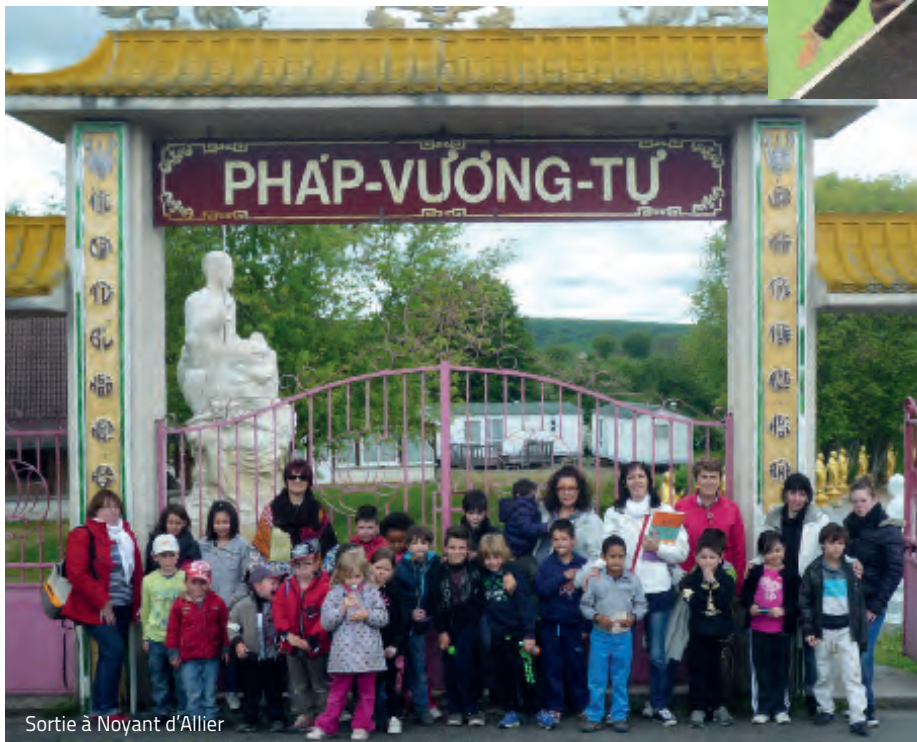
Sortie à Noyant d'Allier

▪ les parents qui se sont impliqués par leur aide, leur temps, en apportant leurs connaissances pour permettre à l'accueil de loisirs de continuer de fonctionner pleinement et de pouvoir offrir aux enfants un monde riche et coloré en échanges et en partages.