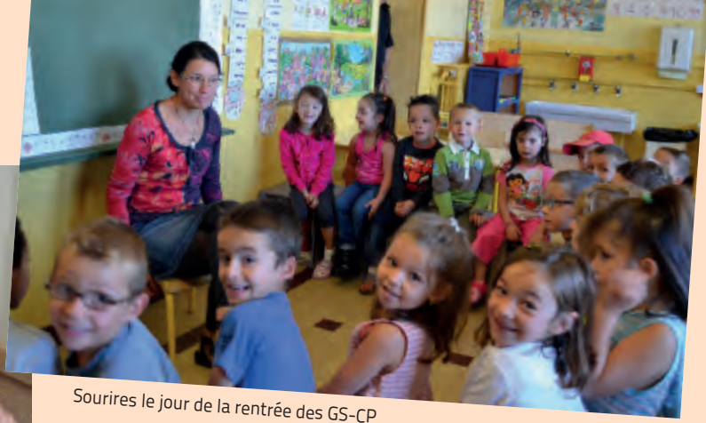
Sourires le jour de la rentrée des GS-CP