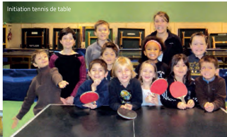
Initiation tennis de table