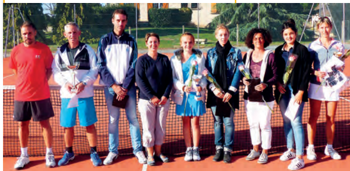
Les lauréats du 13 e tournoi Open du TCEV

Samedi 9 janvier 2016 : Galette des rois Samedi 28 février 2016 : Loto Du 1 er novembre au 10 avril : Tournoi interne du club Fin août début septembre : 14 e tournoi open