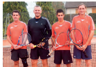
L'équipe masculine, vice championne d'Auvergne en 3 e série

Le club a aussi affiché une belle convivialité lors de rencontres sportives tels le tournoi interne réservé aux licenciés du club qui pour la 1 ère année a proposé des rencontres de doubles mixtes, et le tournoi open qui a comme à son habitude eu un franc succès tant sur les cours (le tournoi a effectivement affiché complet) qu'au niveau du public venu nombreux pour encourager les participants.