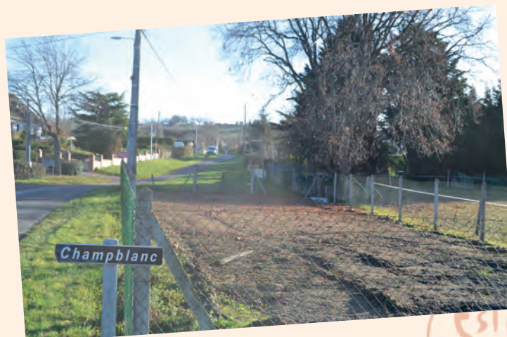
Emplacement réserve incendie Champblanc