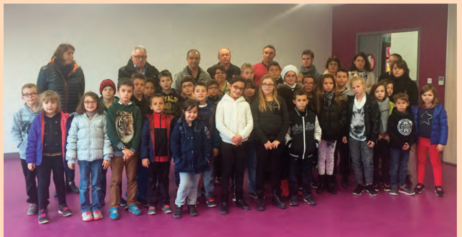
Minute de silence à l'école suite aux attentats de novembre 2015