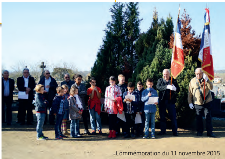
Commémoration du 11 novembre 2015

La section ACPG-CATM-Veuves vous présente ses meilleurs vœux pour 2016.