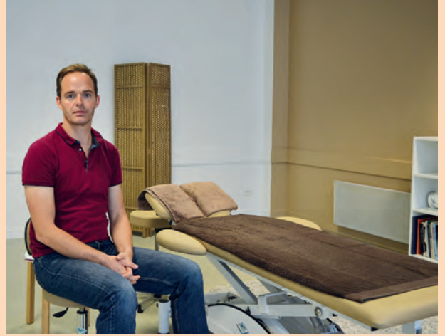
Installation d'un ostéopathe dans l'espace médical réaménagé