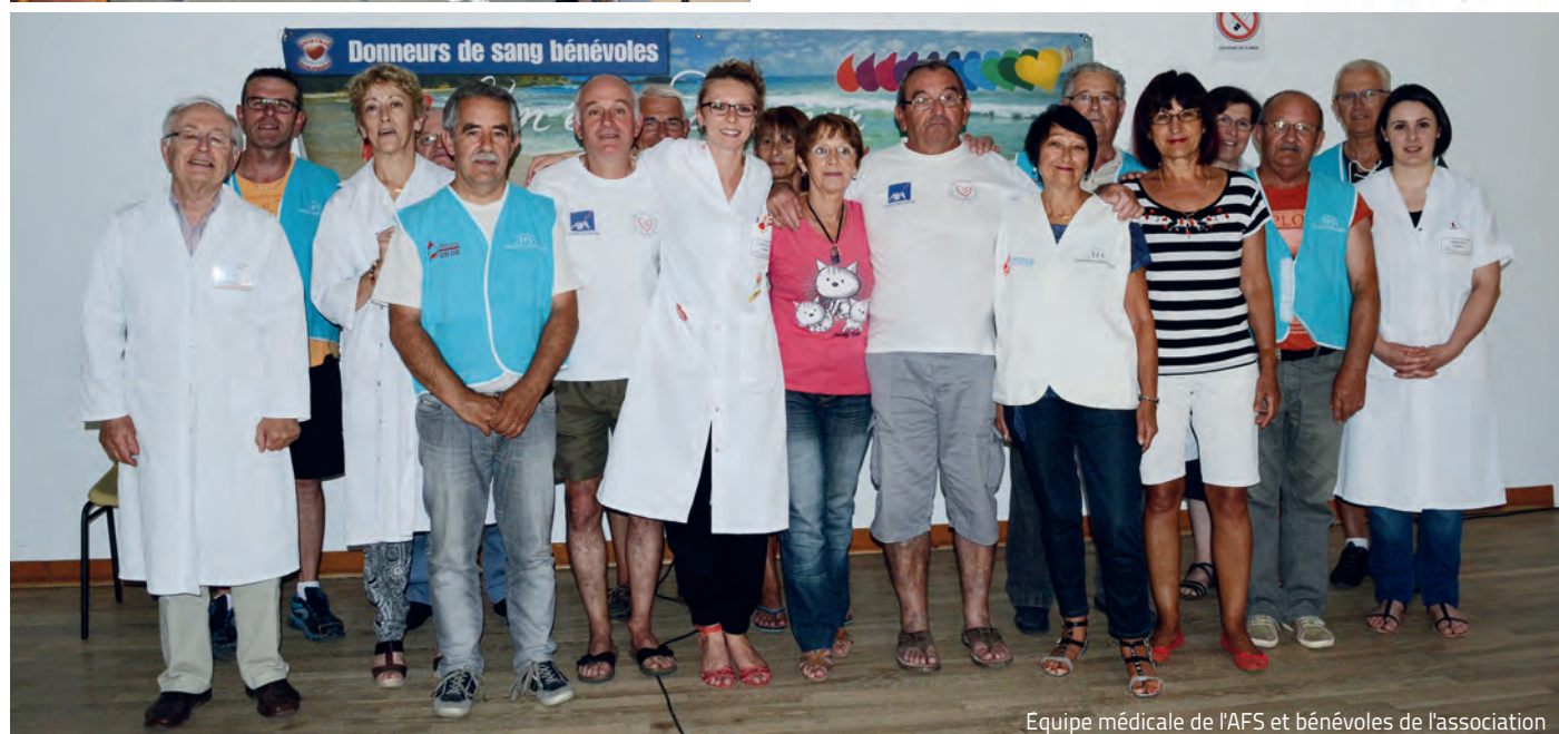
Equipe médicale de l'AFS et bénévoles de l'association