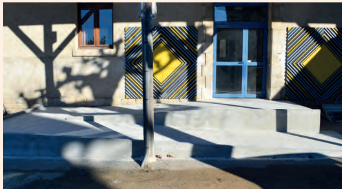
Poursuite de l'aménagement espace médical