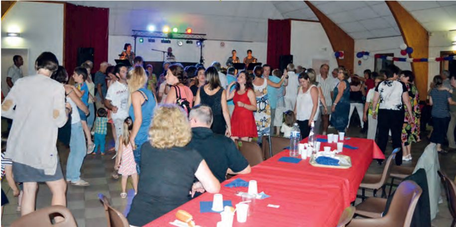
Bal 13 juillet

Samedi 20 février : Repas dansant Samedi 16 avril : Théâtre Dimanche 19 juin : Brocante Dimanche 3 juillet : Rallye promenade Mercredi 13 juillet : Retraite aux Flambeaux suivie du bal gratuit Samedi 5 novembre : Repas Dansant Vendredi 16 décembre : Spectacle à définir Dimanche 18 décembre : Marché de Noël