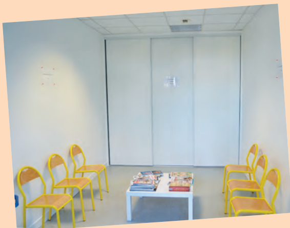
Salle attente de l'espace médical