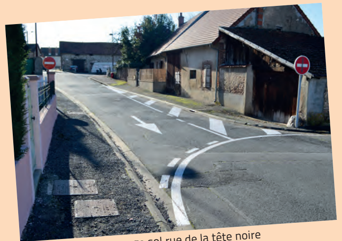
Sécurisation marquage sol rue de la tête noire