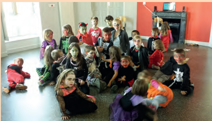
Mise en place de centre de loisirs pendant les vacances scolaires (ici Halloween au chateau des Trillers à Vaux)