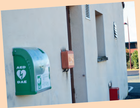
Installation défibrillateur parking salle polyvalente