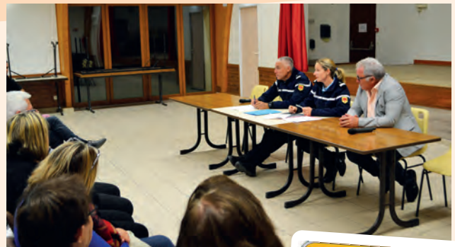
Réunion information pour opération participation citoyenne