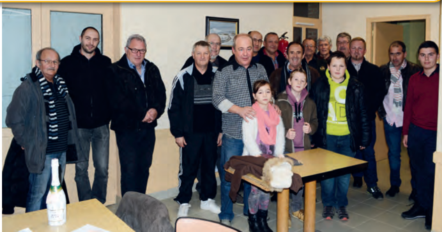
Tirage de la tombola

Nous effectuons donc des battues administratives au renard en présence du lieutenant de louveterie que nous remercions pour sa disponibilité.