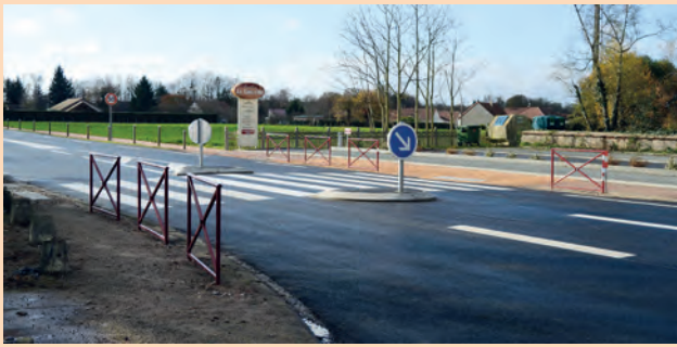
Sécurisation et rénovation RD 2144