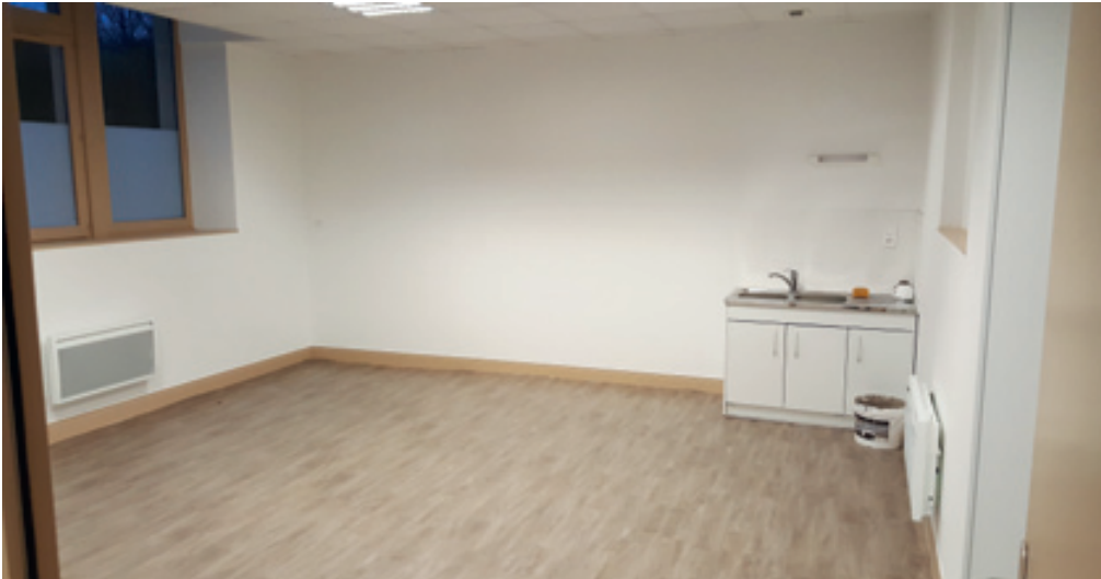
Cabinet médical rénové