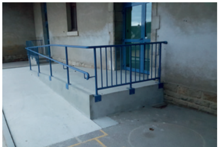
Accès handicapé pour le centre médical