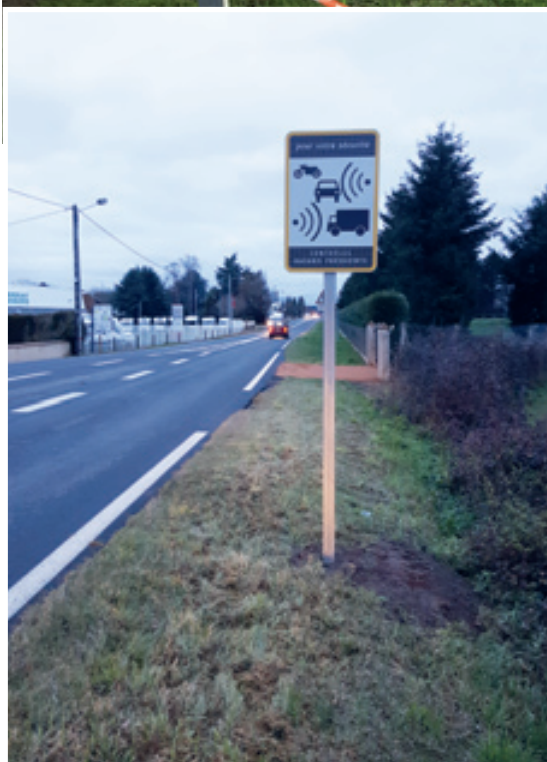
Limitation de vitesse