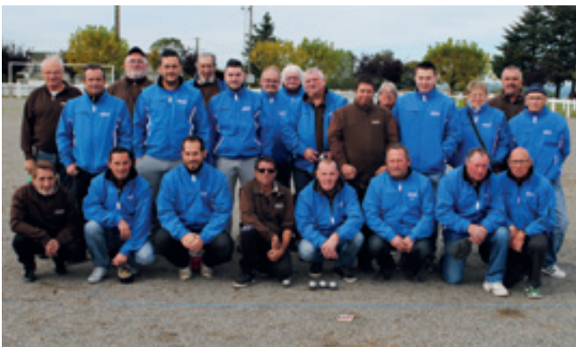
Equipe B avec la coupe du comité

Équipes B, C et vétéran qualifiées pour les phases finales